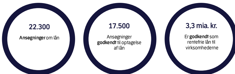
Figur 1. Nøgletal for A-skattelåneordninger

I alt har Skattestyrelsen modtaget ca. 22.300 ansøgninger om et rentefrit lån via de to A-skattelåneordninger, der har været åbne i perioden fra den 3. februar til den 8. april 2021. Samlet er ca. 17.500 ansøgninger blevet godkendt til rentefrie skattelån for ca. 3,3 mia. kr., jf. figur 1.